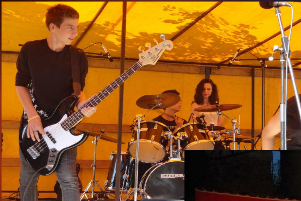
Devil's Diary