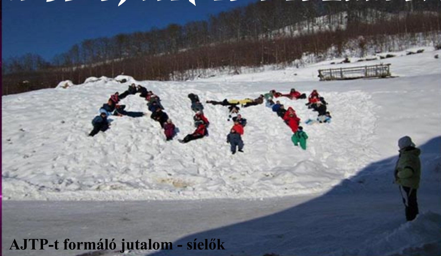
AJTP-t formáló jutalom - síelők