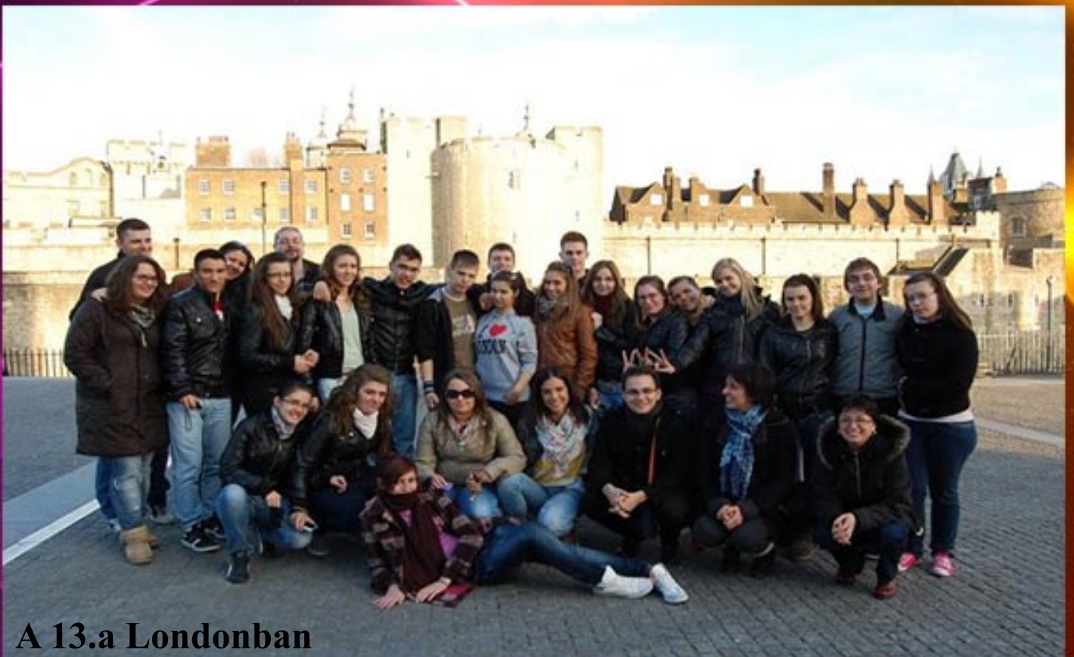
A 13.a Londonban