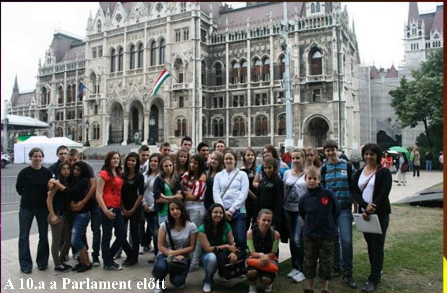
A 10.a a Parlament előtt