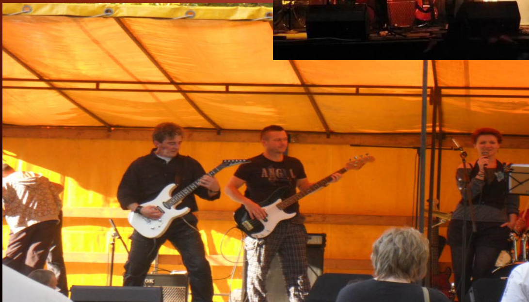
Besi Rock

Többek között az I. szüneti búcsúztató amatőr zenekarok fesztiválján láthattuk, hallhattuk iskolánk három zenekarát. Sok sikert és nagy bulikat kívánunk nekik!